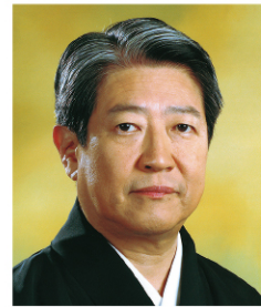
富山清琴(人間国宝) 【箏】

舞踊家。大分県日田市生まれ。東京バレエ団でバレエダンサーとしてキャリアをスタート。2007年に国立劇場歌舞伎俳優養成課の研修生に。人間国宝・坂東玉三郎氏との出会いで大きな影響を受け、2010年に中村獅童一門に入る。2016年に舞踊家へ転身、「梅川壱ノ介」へ改名。日本舞踊を基軸とし、国内外での日本舞踊の公演、また古典や現代アート、絵本の世界などのコラボレーション舞台を手掛ける他、司会やモデルなども務めている。新進気鋭の存在として注目を集めている。